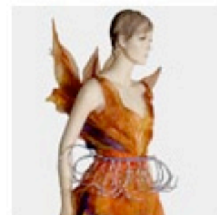
אגם מעורר השראה במזרקה. העיצוב של חן שילה ממכללת מרים