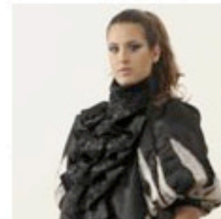
בהשראת כנסית עמנואל בתל אביב. נעה אמור למכללת ויצ"ל